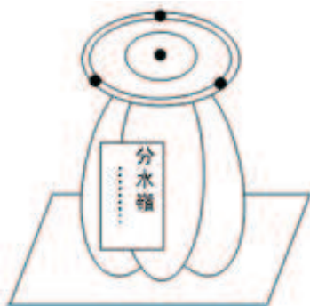
3つの自然石の組合せで製作

交差点に降った雨が受け皿から三方向に流れる。一つは手賀沼水系一つは印旛沼水系へ、一つは大柏川経由で東京湾へ流れていくポイントのモニュメントです。河を汚さない為の最上流部に住む鎌ヶ谷市民として、心がけることをイラストで表示する看板もあわせて製作します。 建設資金百万円予定しています。お志、多少に関わらず申し受けます。皆様の協力が不可欠です。資金カンパ、よろしくお願いたします。ご連絡、お待ちしております。 河川の水質を汚さないための市民運動も併せて行う事業です。