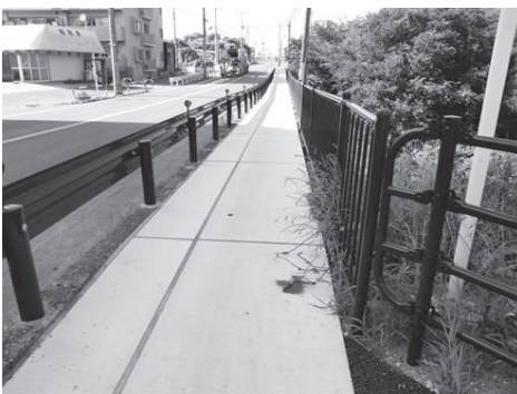
昨年九月議会で一般質問・要望 今年三月完成