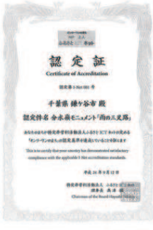
「オンリーワンのまち」 第1号認定証

認定理由。命の水がテーマの分水嶺(界)モニュメント『雨の三叉路』が市民の発意で建設され、市に寄贈されたこと。中心市街地にあること。三つの水系に分かれて流れていく、極めて珍重かつ意外性のあること。まなびいプラザ玄関前に一月二十三日市に寄贈。NPO法人ふるさとICTネットワークが「オンリーワンのまち」が第一号認定。